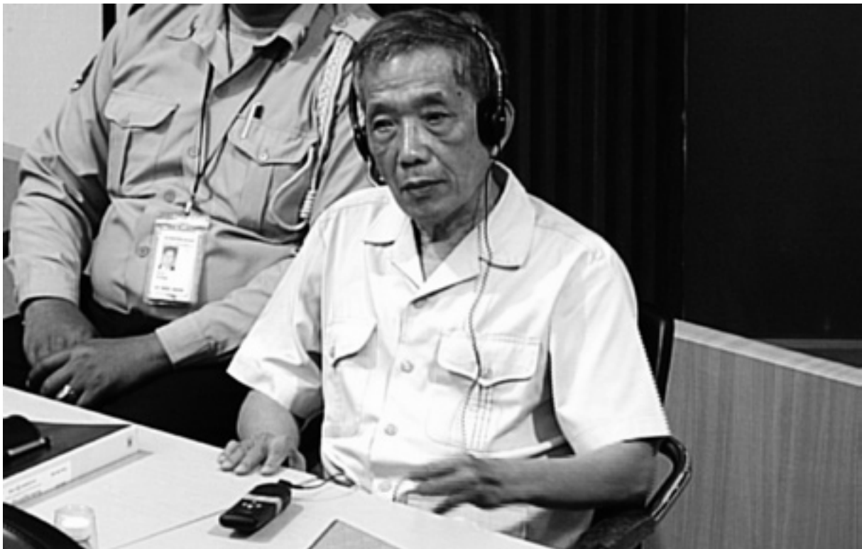
Duch in een rechtszaal van de ECCC

wil zeggen dat geschoolde Cambodjanen door hulp en niet-gouvernementele organisaties worden aange-trokken, en worden weggezoegen van de nationale poli-tieke arena. Tegelijkertijd nemen donoren en NGO's de financiering van onderwijs, gezondheidszorg, soci-ale zorg en de ontwikkeling van landbouw over van de regering. De instandhouding van financiële hulp en het feit dat buitenlandse organisaties de taken van de overheid overnemen, ontmoedigen de Cambodjaanse regering om initiatief te nemen en het systeem te her-vormen. 43