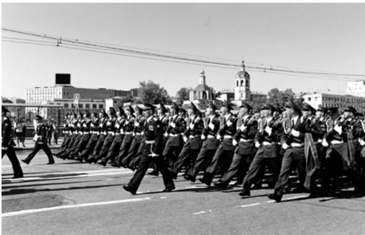
Marcherende Russische militairen in de overwinningssparade op 9 mei 2009

nen de discrepantie tussen het aantal officieren in vergelijking met dat van de overige militairen op te heffen. Tot dan toe was tussen een derde en de helft van de strijdkrachten gevuld met officieren. Een typisch geval van 'Many chiefs and few Indians'. Voorts zal een professioneel onderofficierscorps worden opgezet. Dit zal het aantal inzetbare gevechtstroepen verhogen en de gevechtsgereedheid van de krijgsmacht verbeteren.