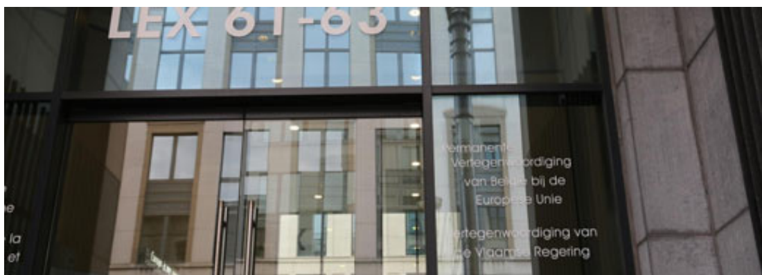
Vertegenwoordiging van de Vlaamse regering bij de EU in Brussel.

Anno 2015 zijn er ook Algemene Afvaardigingen in Warschau, Berlijn, Wenen, Madrid, Parijs, Londen, New York, Pretoria, bij de EU in Brussel en in Genève bij de VN-instellingen. Sommige posten bedienen meerdere landen. Zo is Warschau verantwoordelijk voor de drie Baltische republieken en wordt er vanuit de Oostenrijkse hoofdstad een flink stuk van Midden-Europa bediend. Alle Algemene Afvaardigingen maken deel uit van een Belgische diplomatieke post – een ambassade, consulaat-generaal of een Permanente Vertegenwoordiging in het geval van multilaterale organisaties. [4]