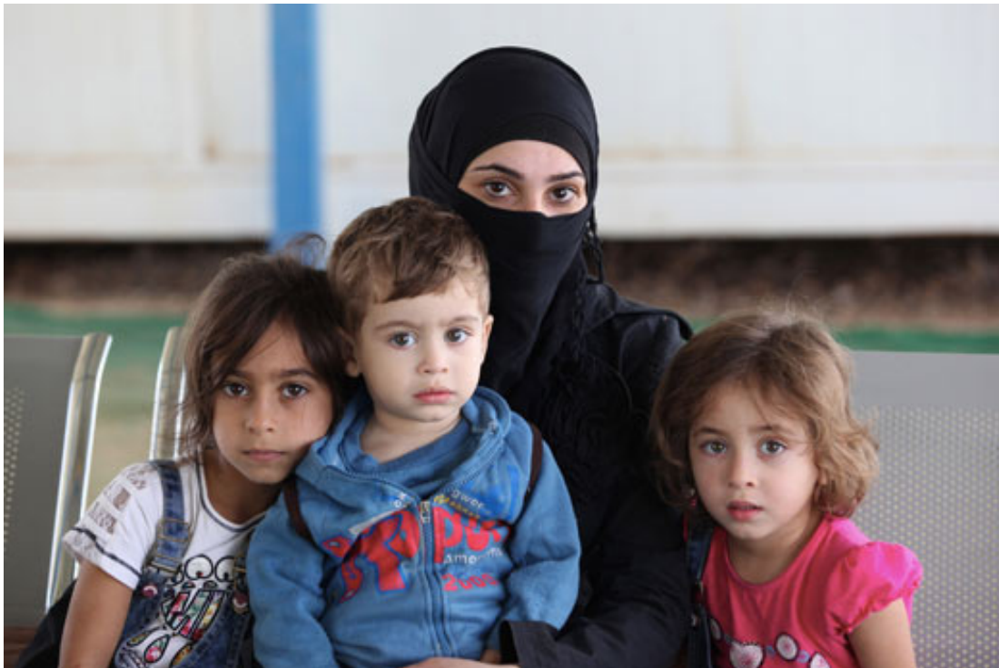
Een Syrische vluchteling met haar kinderen begin november 2015 in een opvangkamp in Zaatari, Jordanië.

De opvang wordt de facto al jaren overgelaten aan andere buurlanden, wat eufemistisch ‘de regio’ wordt genoemd. Meer dan 90% van de vluchtelingen verblijft al in landen als Turkije, Jordanië en Libanon. Zij zitten niet te wachten op het opvangen van nóg meer vluchtelingen. Het mantra van opvang in de regio is daarmee verhullende taal voor een politiek van morele uitbesteding. Het definieert een regio zonder zich daar zelf toe te rekenen. En het gooit problemen over een zelf gedefinieerde heg, onderwijl de eigen grenzen nog verder sluitend.