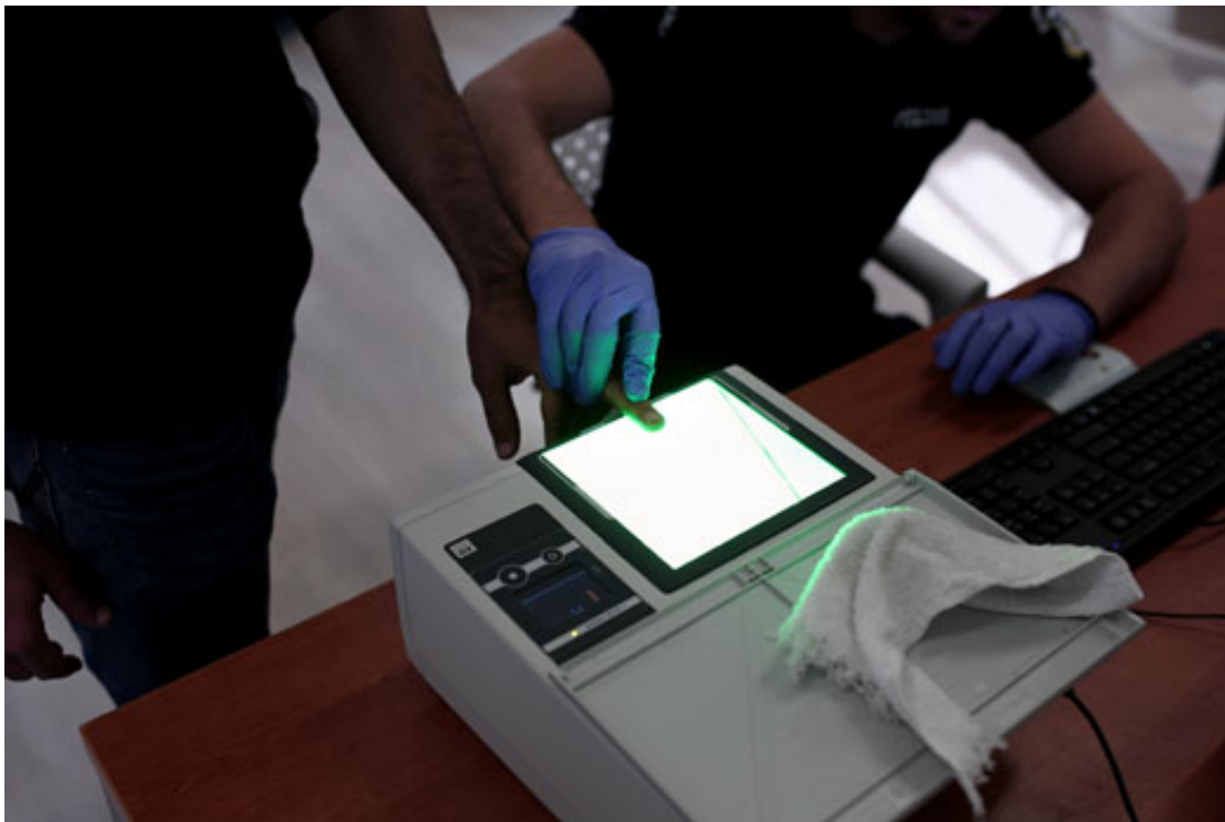
Registratie van bootvluchtelingen op het Griekse eiland Lesbos.

Dat is weinig anders dan een mondiale standenmaatschappij. Met verstreckende geografische gevolgen. Want doordat de reguliere weg afgesloten is, blijft voor de geografisch ‘verkeerd geboren’ veelal alleen de irreguliere weg over. Ook voor degenen die recht hebben op asiel. En die irreguliere weg is, zoals we dagelijks zien, mensonterend en extreem gevaarlijk. De EU-grens is inmiddels de dodelijkste grens op aarde. Sinds 1995 zijn bijna 23.000 migranten gestorven. En vooral de EU is daarvoor verantwoordelijk: dood door beleid. Maar nog altijd verandert het beleid niet.