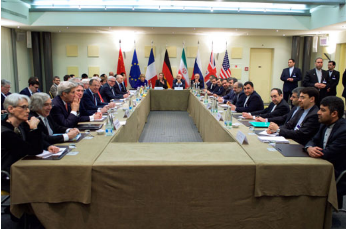
Multilateraal overleg over het atoomakkoord met Iran in 2015.

Het probleem is dat deze constructivistische benadering moeilijk alternatieven naar voren kan schuiven en daardoor minder bruikbaar is wat beleidsadvisering betreft. Toch heeft de Kritische Geopolitiek intussen zijn plaats verworven binnen de veelheid van geopolitieke denkscholen, al zien we recentelijk door de vernieuwde aandacht voor de ‘high politics’ in de internationale betrekkingen een gedeeltelijke terugkeer naar neo-klassieke geopolitieke denkscholen.