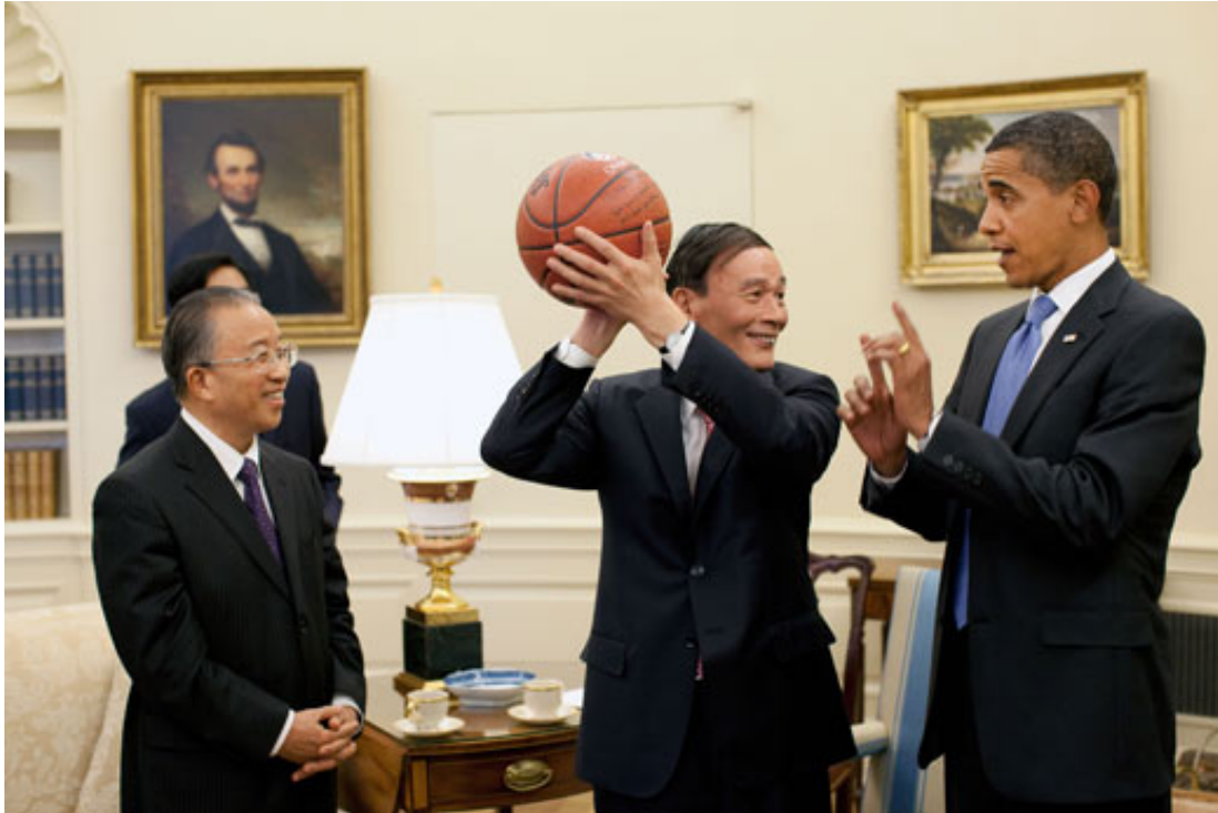
De toenmalige Chinese vice-premier Wang Qishan houdt de door president Obama gesigndeerde basketbal vast na de eerste US-China Strategic and Economic Dialogue in 2009.